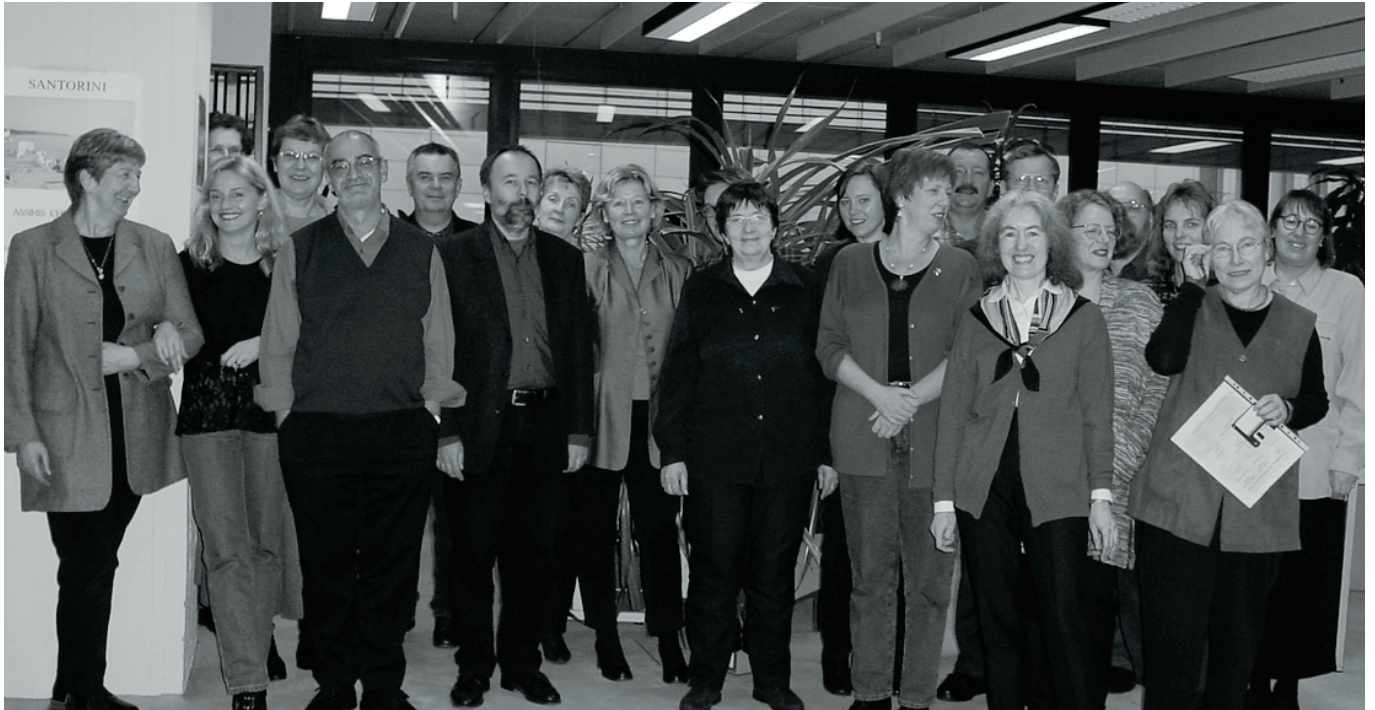
Ein Teil des ZDB-Teams der Abteilung II E

deuten Begriffe im Titel wie Bibliographie, Zeitschriftenschau, catalogue u.ä. auf fortlaufendes Updating hin, ähnlich wie dies auch bei Printausgaben fortlaufender Sammelwerke gilt. Ansonsten muss in der Ressource selbst nach entsprechenden Hinweisen (z.B. the database is a steadily growing collection ..., the file continues to be updated and expanded daily... u.ä.) gesucht werden.